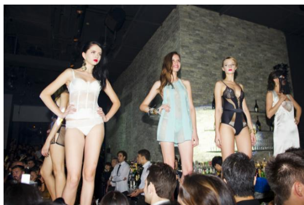
2012 M1NT 黑天鹅派对-LA PERLA 时尚走秀